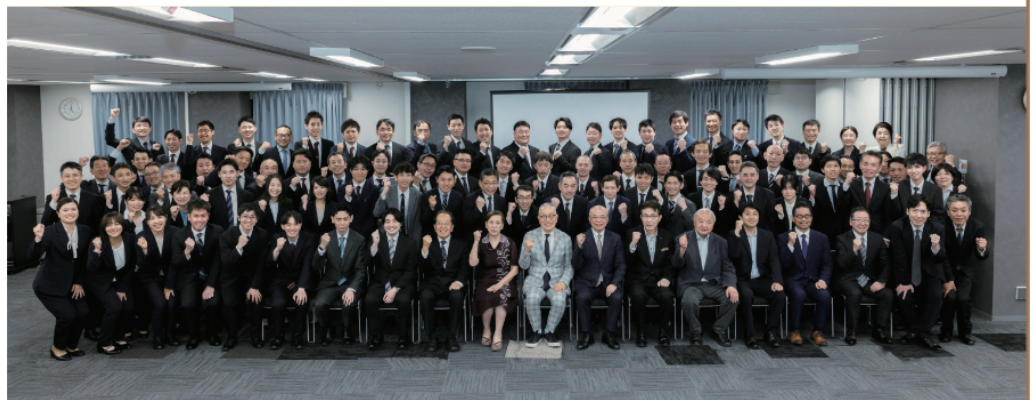
「2026年度経営指針書発表会」にて全店長との集合写真