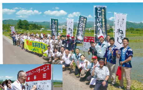
お米の生産地 JA会津よつばの農家の皆さんとねぎしのスタッフ