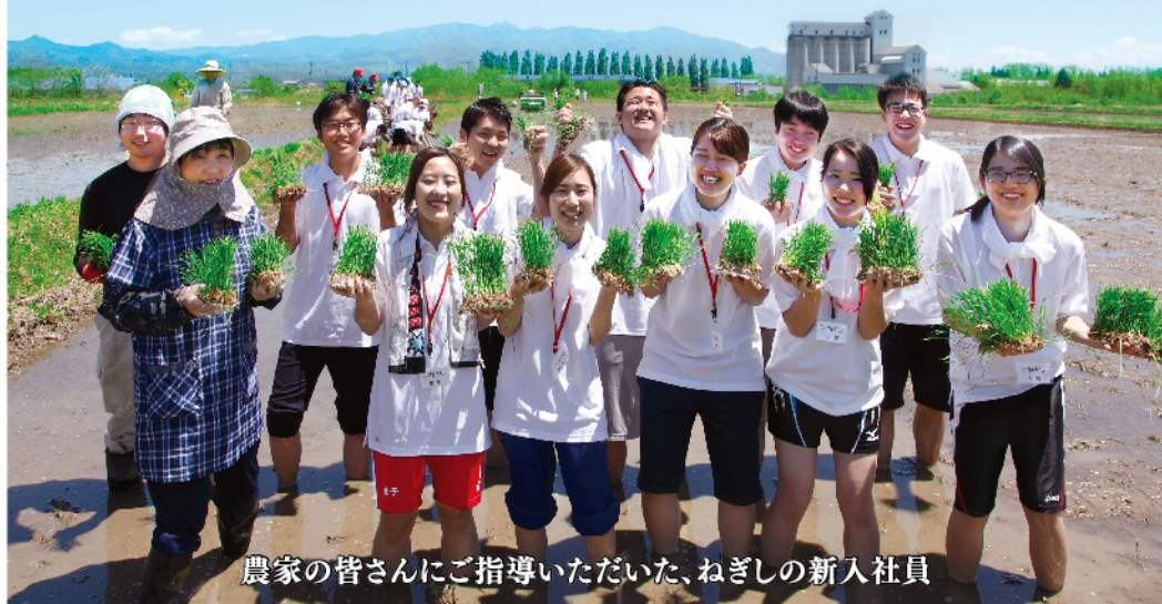
農家の皆さんにご指導いただいた、ねぎしの新入社員

福島県会津喜多方にて春は田植え、秋には稲刈り体験し、生産者の皆さんと交流しています。 ねぎしの麦めしは、おかわり自由。食べれば食べるほど日本の食料自給率アップ!