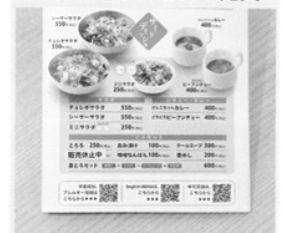
二次元コードで栄養成分とアレルギー情報、外国語訳の入手が可能。コロナ禍以降、LINEアンケートへの回答で200円割引のサービスも。