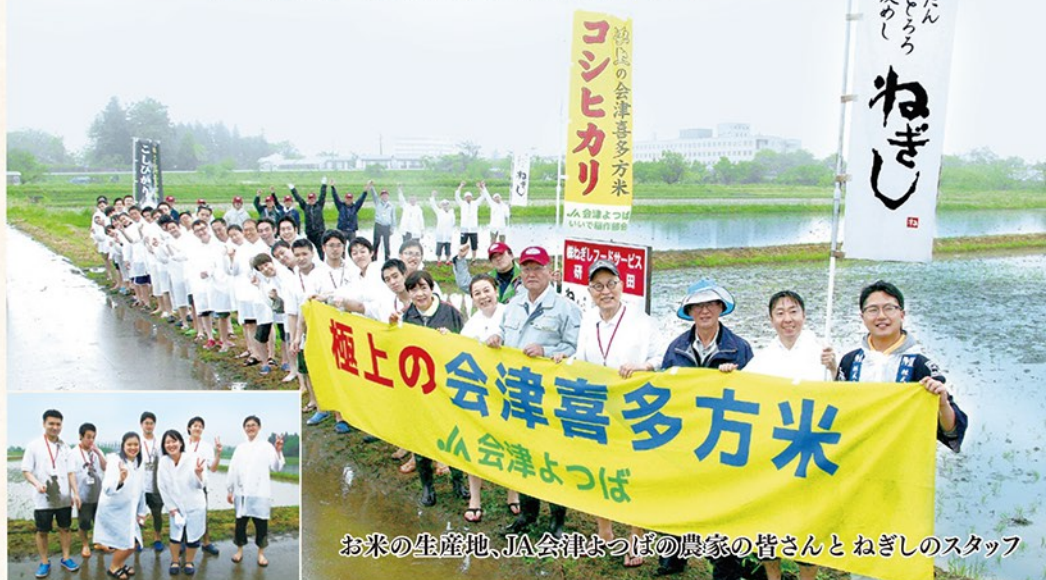
お米の生産地、JA会津よつばの農家の皆さんとねぎしのスタッフ